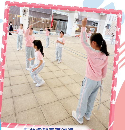
有些同學喜愛跳繩，並與同學互相切磋技藝。