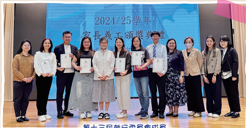
第十三屆執行委員會成員