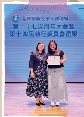
2024/25 學年 「家長扭波義工團」