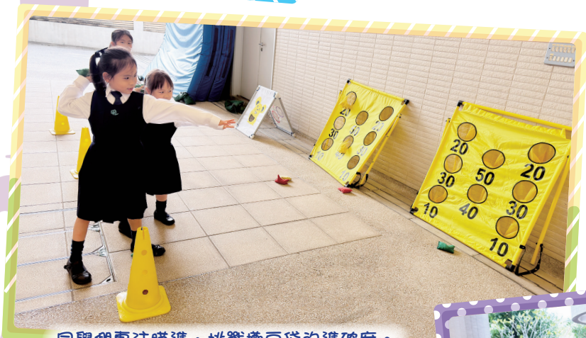
同學們專注瞄準，挑戰擲豆袋的準確度。