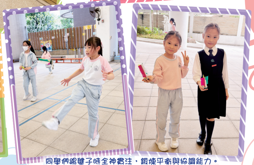
同學們踢毽子時全神貫注，鍛煉平衡與協調能力。