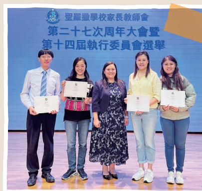
2024/25學年校車監察委員會