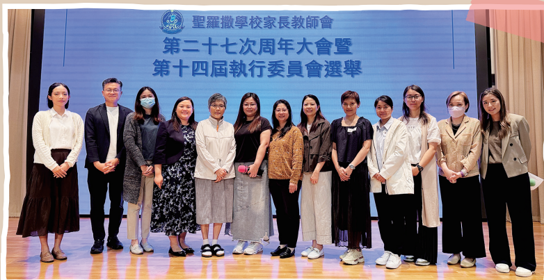
第十四屆執行委員會

未來一年，精彩活動將接踵而至！誠摯邀請大家積極參與活動，與我們一起為孩子們點亮更多溫暖又難忘的校園時光。