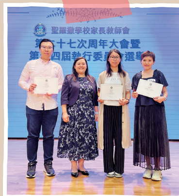
2024/25 學年 編輯排版小組委員會