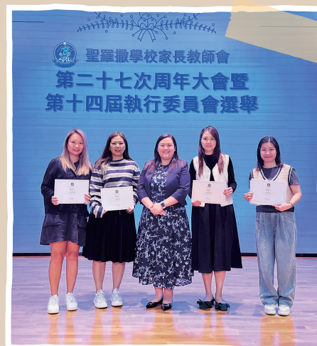
2024/25 學年家長義工召集人