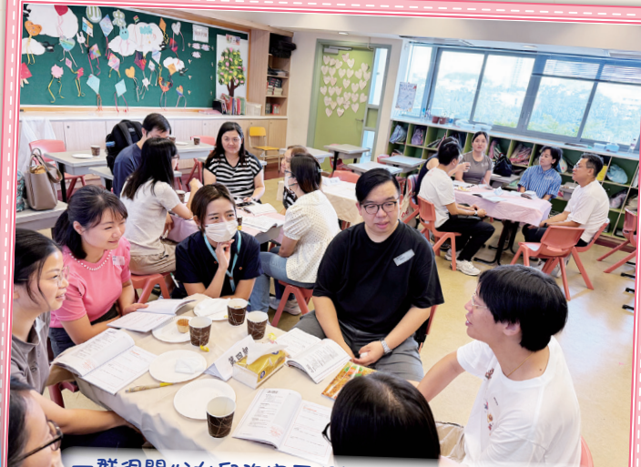
一群很關心女兒的家長探討如何培育正向的孩子