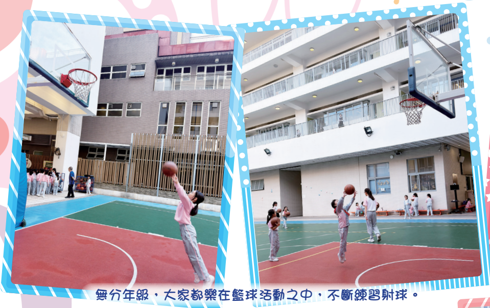
無分年級，大家都樂在籃球活動之中，不斷練習射球。